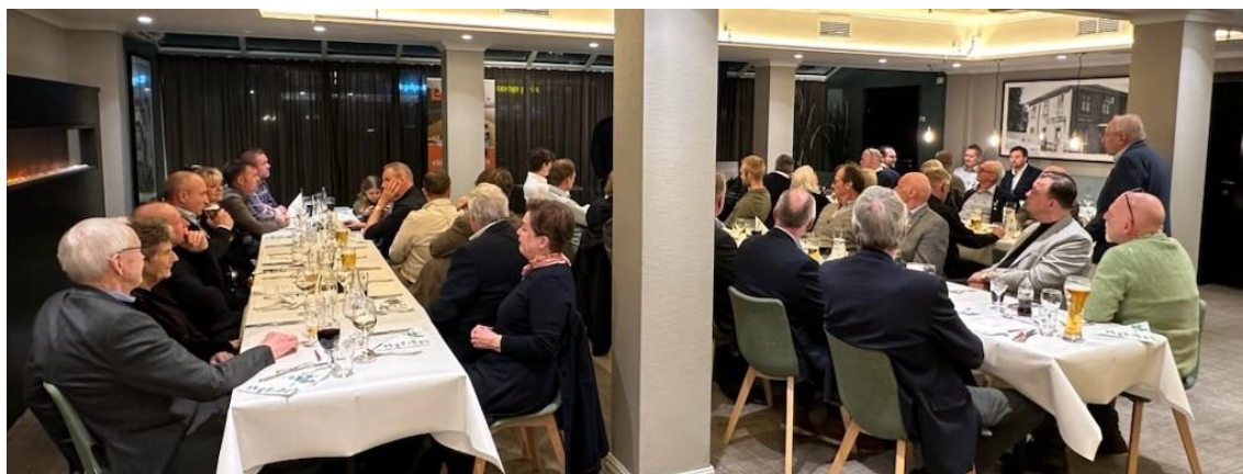
Fra årsmøtet i Drammen og omegn Lastebileierforening