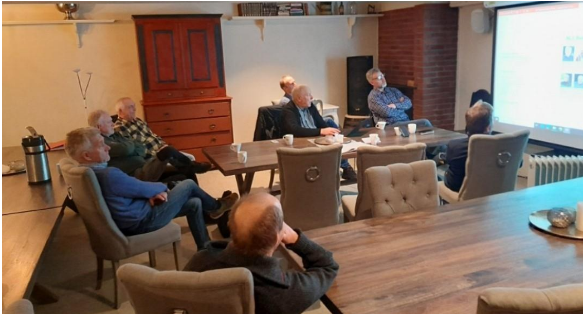
Interessante næringspolitiske diskusjoner på møtet i Eggedal