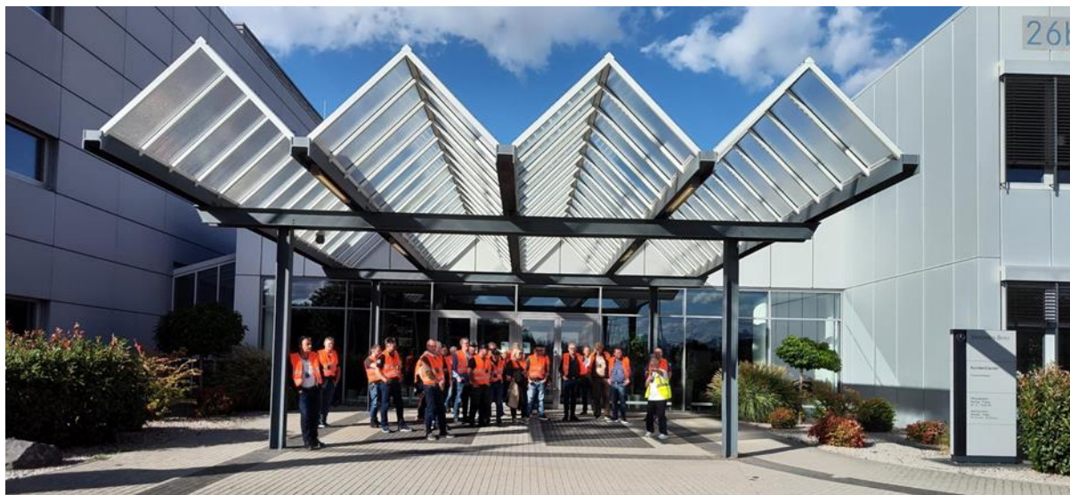
Bilde fra fjorårets studiereise

Pris kr 12 500,-. Tillegg enkeltrom kr 2 500,-.