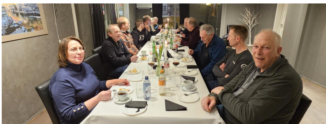
Bilder fra årsmøtemiddagen