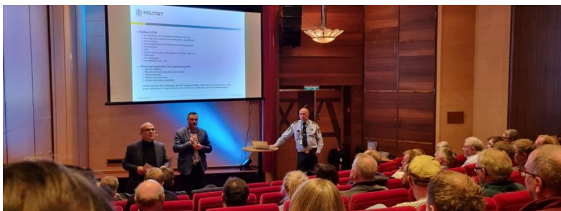
Statens vegvesen og politiet deltok også sine nøkkelpersoner på fjorårets konferanse